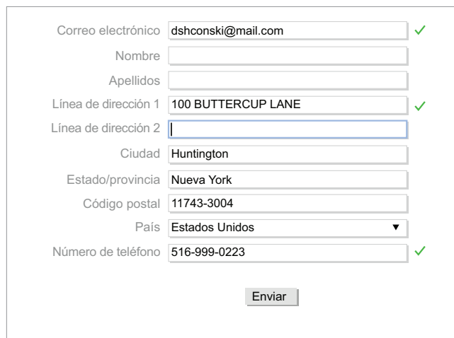
Figura 2: Informática Contact Data Verification presenta la información correcta al cliente en tiempo real.