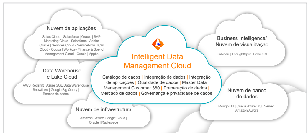
Figura 1: A Informatica Intelligent Data Management Cloud é a primeira e única nuvem do setor focada exclusivamente no gerenciamento de dados.

Agora você pode alcançar e acelerar sua transformação digital indo atrás do elo que falta em sua jornada de modernização da nuvem: os dados. Você já viu várias nuvens – infraestrutura, banco de dados, aplicações, inteligência comercial e data warehouse e lake. Agora não seria a hora de focar no ativo mais essencial do seu negócio, os dados? Com uma nuvem de gerenciamento de dados, será possível de fato gerenciar e inovar com seus dados em qualquer plataforma, nuvem e usuário, seja em ambientes multihíbridos ou multinuvm.